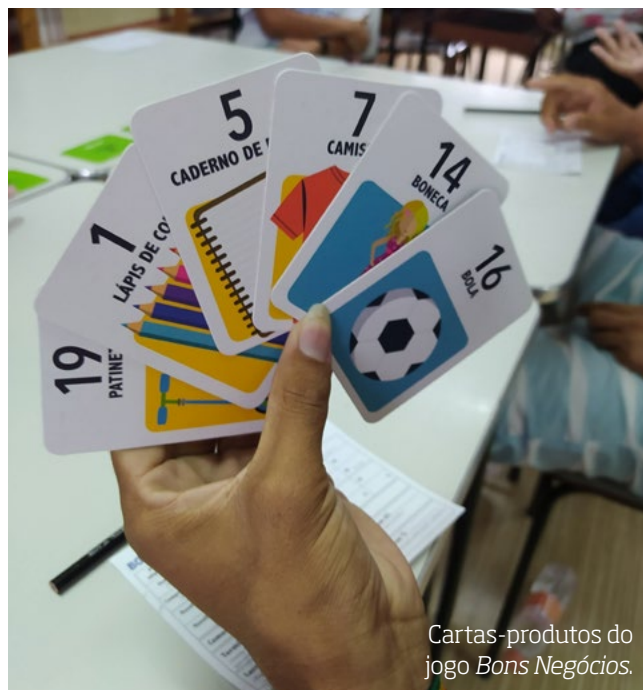
Cartas-produtos do jogo Bons Negócios .

Você pode extrapolar estas discussões a partir destes jogos em sua sala de aula usando jogos populares de cartas e tabuleiro, ou ainda analisando dados estatísticos que permitam previsões. Este é outro campo importante para debate com os estudantes. Perguntas como “Qual a probabilidade de chover hoje?” estão carregadas de uma análise complexa de dados por parte de meteorologistas que trabalham com o campo da incerteza sobre os dados pesquisados. É um ótimo exemplo para discussões sobre o contexto ambiental presente em muito do trabalho feito a partir dos jogos disponibilizados pelo IBS em suas ações.