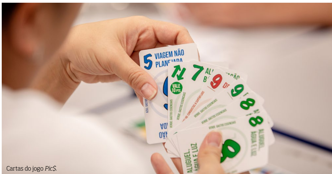
Cartas do jogo Pic$ .

Estamos falando aqui sobre o desenvolvimento do pensamento probabilístico dos estudantes, pensando a partir da experimentação.