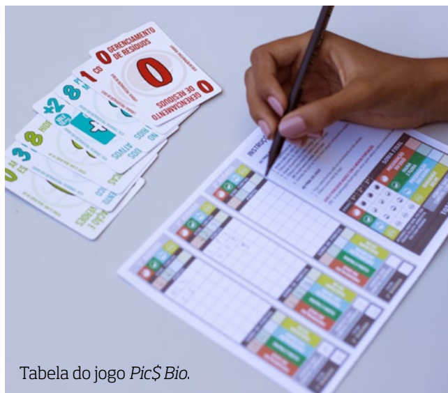
Tabela do jogo Pic$ Bio .

Um primeiro olhar que devemos ter é para as tabelas apresentadas para cada um dos jogos. Elas podem ser o ponto de partida de muitas discussões sobre a organização das informações colhidas ao longo da partida por cada jogador, assim como há a possibilidade de transformá-las em planilhas eletrônicas, usando os recursos disponíveis para a turma (computador ou celular). Caso os estudantes não tenham acesso aos recursos digitais, você, professor(a), pode promover debates sobre melhorias e reorganizações de dados usados ao longo das partidas dos jogos Piquenique , Bons Negócios , e os jogos da família Pic$ .