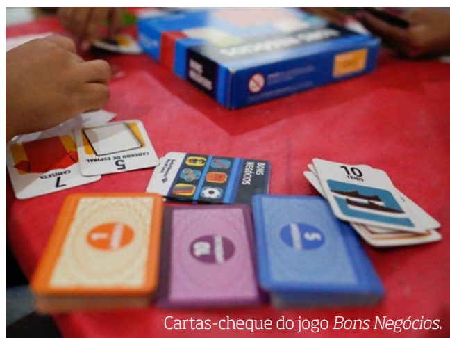
Cartas-cheque do jogo Bons Negócios .

Na sequência de estudos do nosso fascículo, vamos ampliar nosso olhar para outras ideias da Álgebra e para a importância delas em nosso trabalho em sala de aula.