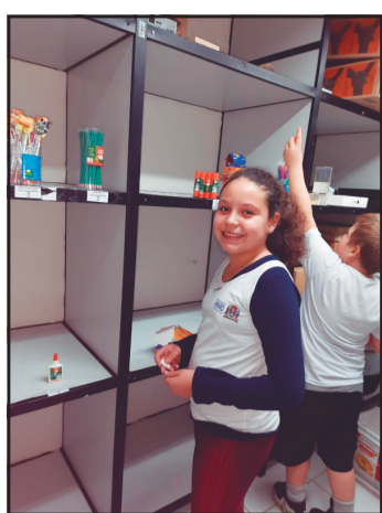
Com a entrega de recicláveis, os alunos podem adquirir materiais escolares e brinquedos

Uma vez por semana, os alunos levam as embalagens plásticas separadas e limpas, a coordenadora do projeto pesa o material a ser reciclado e o aluno recebe uma quantia monetária na moeda “Raulzinho” (homenagem ao patrono da escola). A moeda “Raulzinho” foi criada exclusivamente para o projeto, através de um concurso de desenho entre os alunos; tem circulação interna e é aceita na lojinha “troca do bem”, localizada na própria escola, que funciona todas as terças-feiras, oferecendo para a tro-