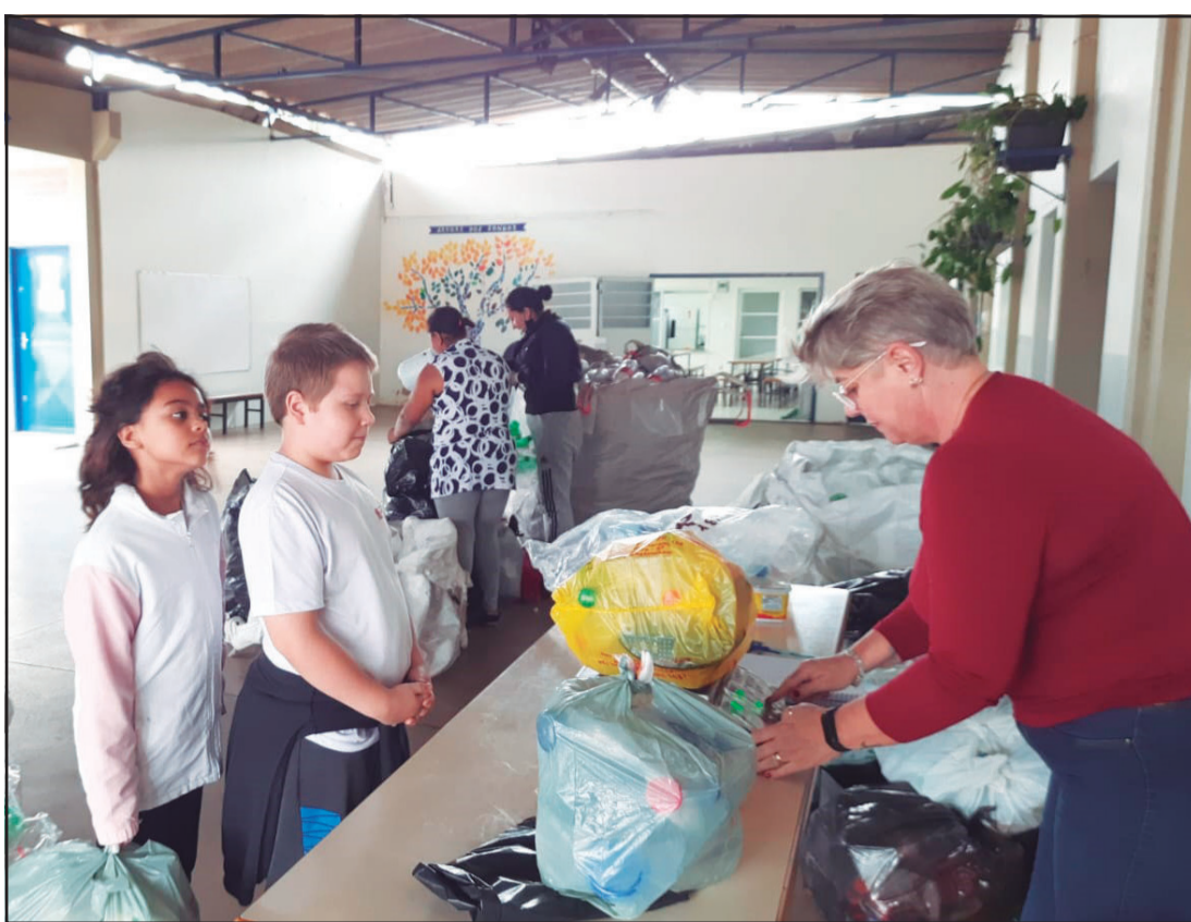
Alunos da EE Raul de Oliveira Fagundes, em Amparo, entregam materiais recicláveis

“Além da conscientização ambiental, o projeto também valoriza a educação financeira, demonstrando às crianças que é possível o consumo consciente e, claro, ajudando na aquisição do material escolar dos alunos”, diz nota divulgada pela escola.