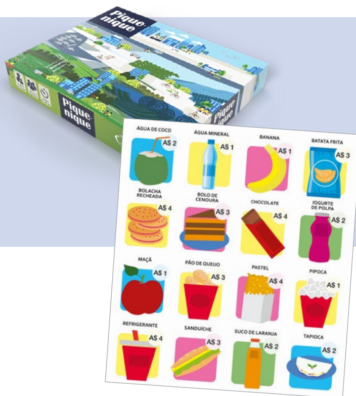
Tabela de produtos impressa para cada aluno